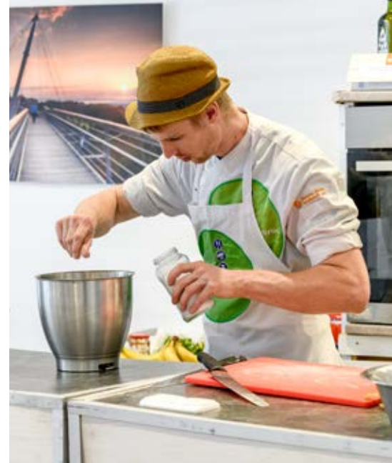
Text und Bild: Scheidegg-Tourismus