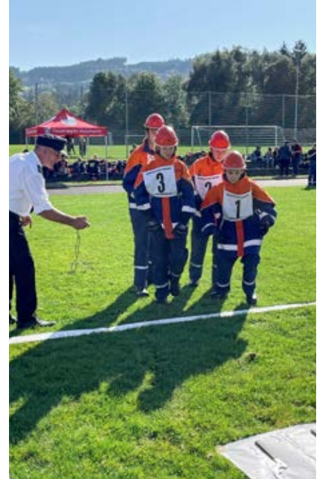
Text und Bilder: Sebastian Heiser, Freiwillige Feuerwehr Scheidegg e. V.

Folgt uns auch auf Instagram, Facebook oder TikTok, um immer auf dem Laufenden zu sein. #wirfürscheidegg